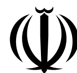
جمهوری اسلامی ایران وزارت راه و شهرسازی