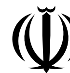
جمهوری اسلامی ایران ریاست جمهوری